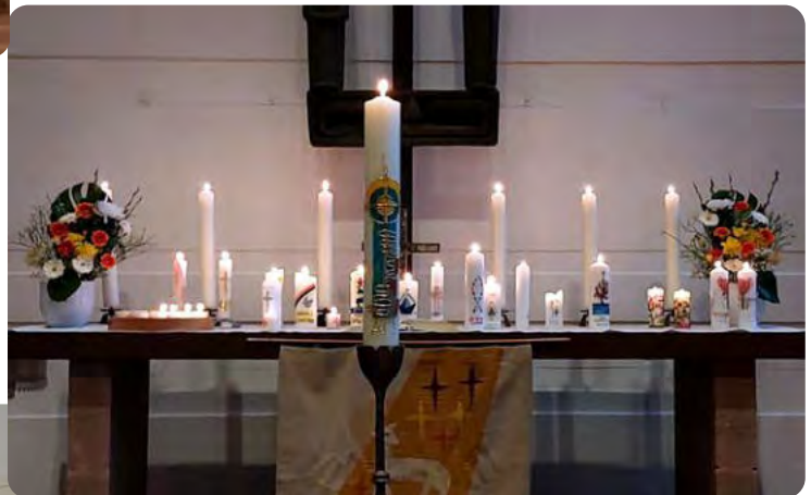
Zwei Gottesdienste in einem ganz besonderen Flair.