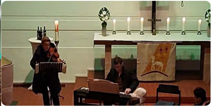
Tischabendmahl am Gründonnerstag und die familienfreundliche Osternacht mit Taufferinnerung am Ostersonntag.