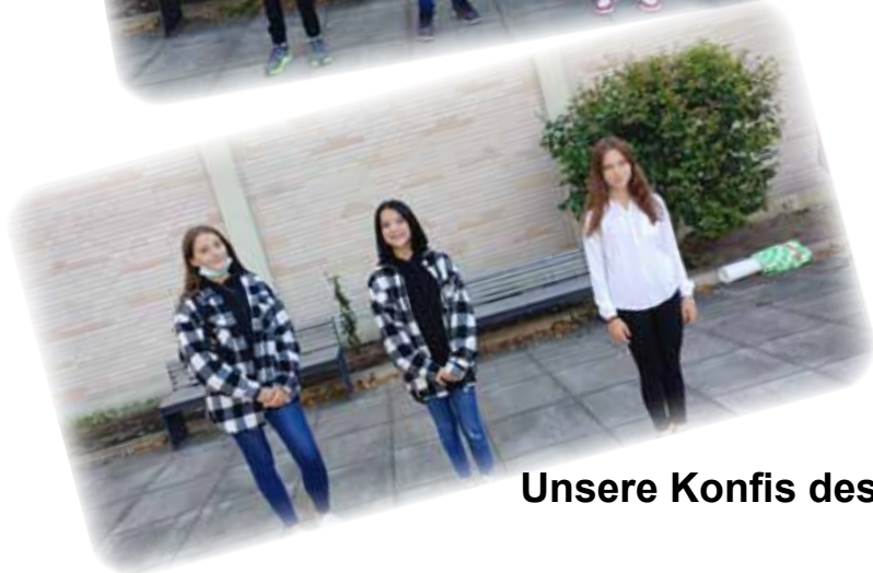
Unsere Konfis des Jahrgangs